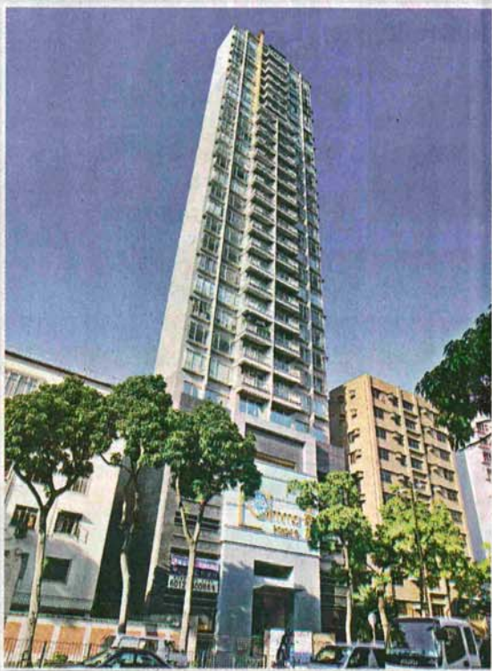
▲藍馬集團與億京合作發展太子道西藍馬豪庭，全幢物業提供40個單位，目前剩餘的5個單位，平均呎價7800元。